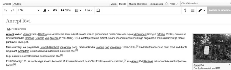
Joonis 1. Artikli muutmine visuaaltoimeti režiimis